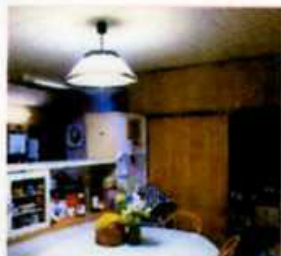
キッチン・ダイニング古くなったのでリフォームをしました。

念願だった壁や床、キッチンのリフォームが完成。でも何か物足りない感じ。そんな時あかりに注目。あかり1つで部屋の印象が驚くほど変わります。