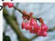
カンヒザクラ (濃いピンク)