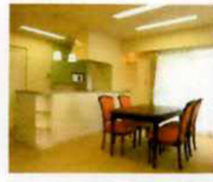
天井をすっきりさせ『あかり』を見直しました。すると・・・