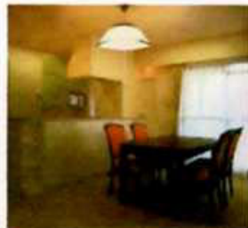
せっかくリフォームしたのに何かピンとこない・・・